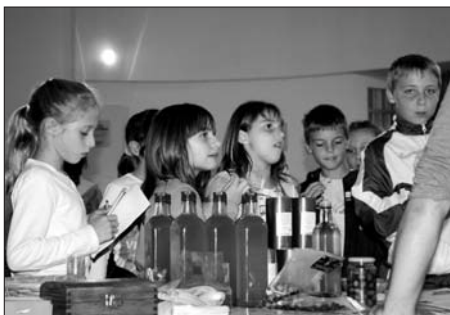
Semaine du goût à Borgo

Cette année, au Lycée de Borgo, l'accent était mis sur la présentation complète de la filière oléicole, de la production jusqu'à la consommation de produits élaborés. «Notre objectif était multiple, expliquent les enseignantes d'Education Socioculturelle et de