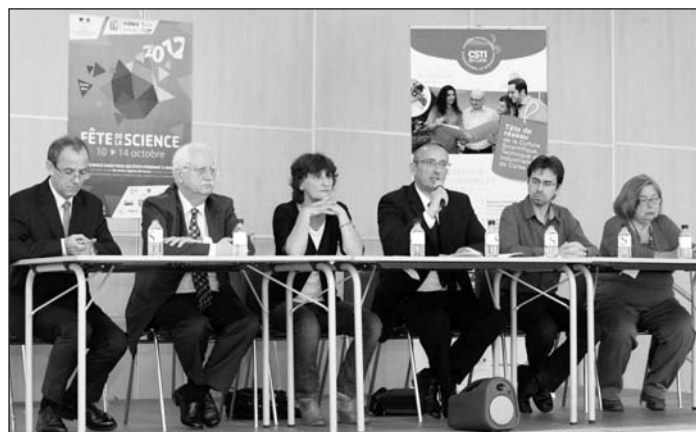
Lors de la cérémonie d'ouverture de la Fête de la Science en présence du parrain Christian Amatore