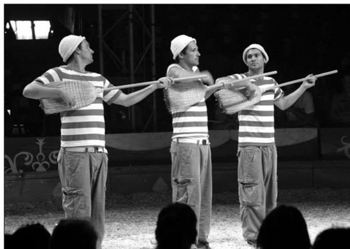
Un trio de comiques acrobates