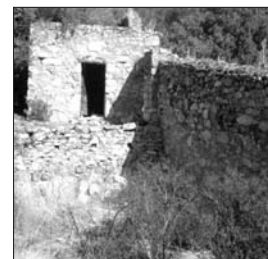
Jardin de Santa Reparata à restaurer