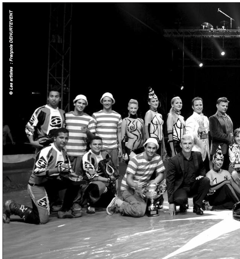
L'heure des récompenses en présence de